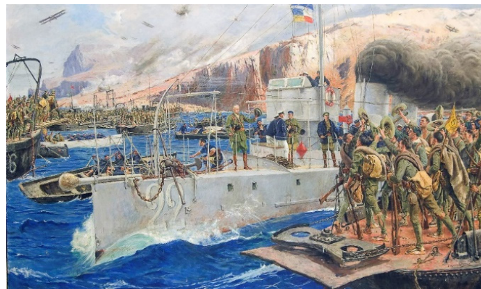
Desembarco de Alhucemas por José Moreno

Quel est le contexte de cette opération d'envergure franco-espagnole préparée à Madrid et à Tanger depuis des mois ?