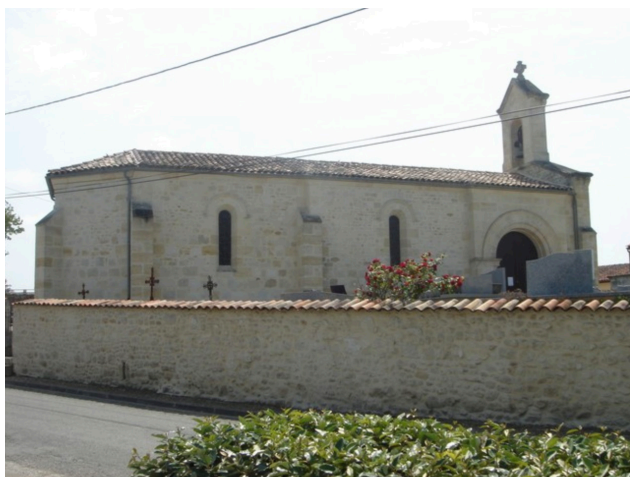
L'église de Prignac-en-Médoc du XII ème siècle est l'ancienne chapelle d'un couvent disparu. Dépourvu de clocher, le bâtiment est néanmoins doté d'un clocheton.

En effet, à Prignac en Médoc, le monument à nos morts de la Grande Guerre est situé dans la chapelle et se compose d'une plaque avec les noms des victimes tombés au champ d'honneur, à quelques centimètres du Christ en croix.