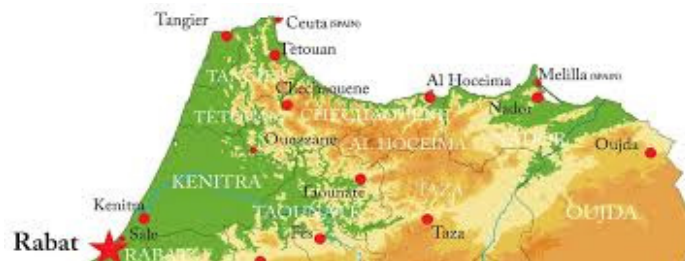
La Chaîne du Rif

Dans le même temps un protectorat espagnol au Maroc est instauré sur la base d'une convention franco-espagnole signée le 27 novembre 1912 à Madrid. Cette convention définit deux zones d'influence espagnole : l'une au nord englobant le massif du Rif et la côte méditerranéenne, elle s'étire sur 300 km de Tétouan à la frontière algérienne (l'Algérie étant colonie française depuis sa conquête en 1830), l'autre au sud d'Agadir autour d'Ifni. Tanger et sa zone conservent un statut international.